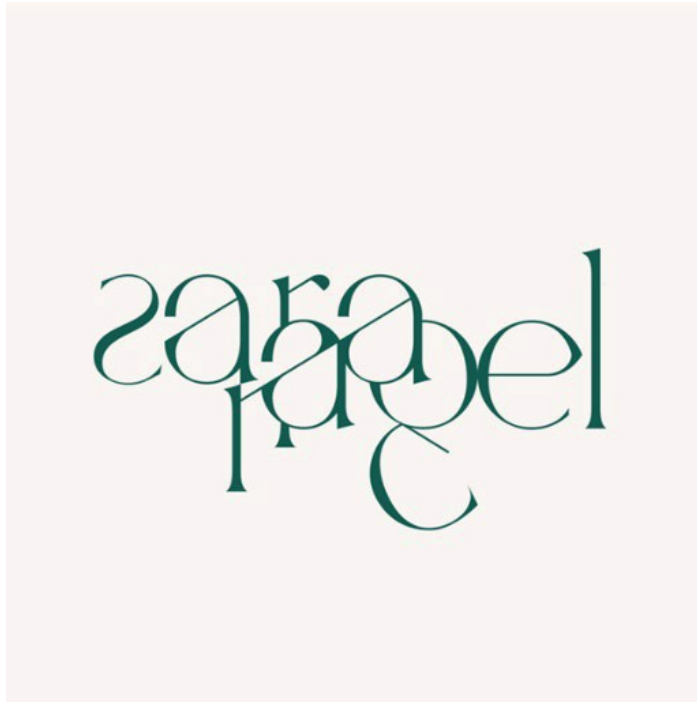
FIGURA 3. Logotipo de Idea de Negocio, esta vez con la combinación de color en negativo (Ver Fig.1), dónde queda articulado visualmente el siguiente contenido: Amable, con ambición, eficiente y creativa, con resultados limpios, aceptando a las claras el desorden y la apertura, para doblarlos con calma.