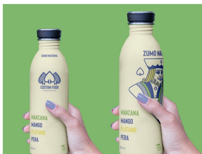
FIGURA 8. Merchandising de promoción en botellas, donde se aprecian las dos líneas de trabajo para la misma Marca Empresa que customiza comida casera a modo de juego