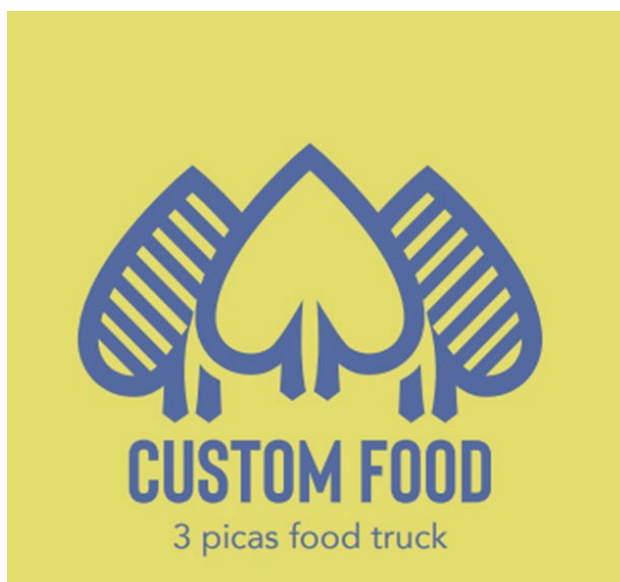
FIGURA 4. Imagotipo 1 de la Idea de Negocio correspondiente a la Marca Empresa ad-hoc de la alumna Diana López Malillos. En la food truck se customiza comida casera a modo de juego.

Vamos a ver la articulación de expresión y contenido con elementos específicos del imagotipo 1, “CUSTOM FOOD/ 3 picas food truck” (Fig. 4): La elección de la Expresión Visual, 3 picas del Juego de cartas, para articular el contenido, de espíritu resolutivo, por la Pica o espada; de espíritu ordenado, por las 3 picas dispuestas en orden; y para la idea de customizar, las 3 picas (dos iguales y una distinta) para articular el significado de, agregar contratiempos, interferencia de un tercero, y nuevas tácticas para circunstancias nuevas.