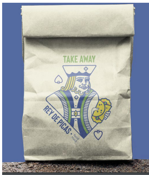
FIGURA 7. Merchandising en bolsa de papel para promocionar la Idea de Negocio con el concepto: Juega a customizar tu comida casera!, ubicada en una food truck. Promoción con el imagotipo 2, REY DE PICAS/ food truck.