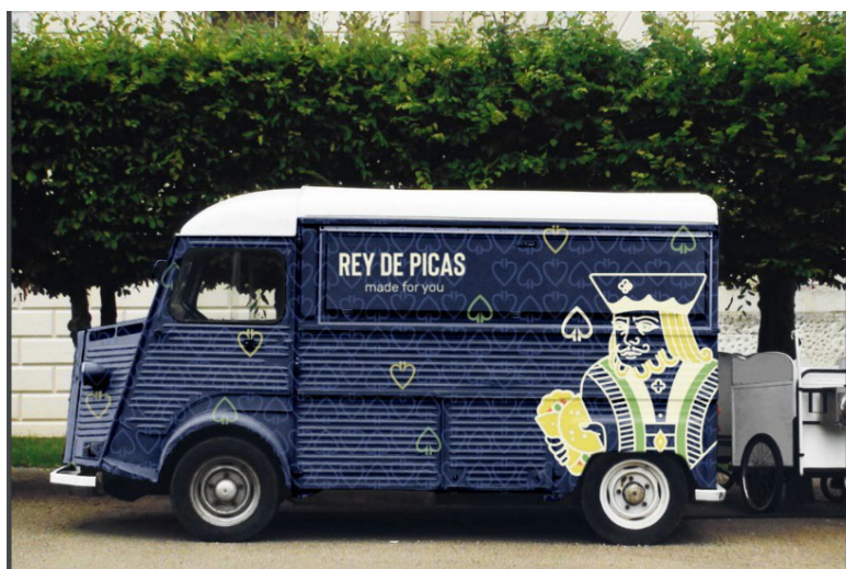
FIGURA 6. Imagen de la food truck con el isotipo y el logotipo REY DE PICAS. La idea de juego se mantiene, al ubicar la empresa de comida de confianza customizada, en una food truck, para vender de manera informal, comida en la calle.